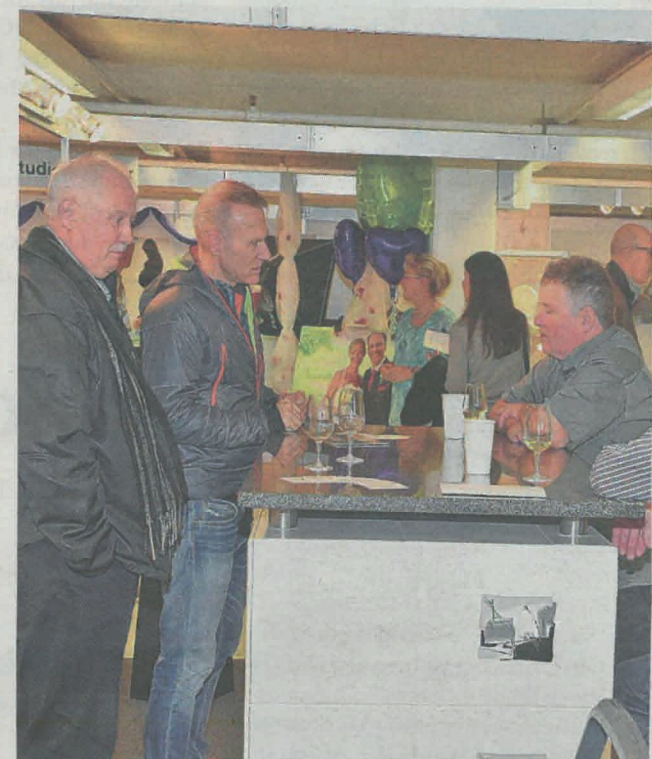
Sinn und Zweck ist allemal der direkte Kundenkontakt