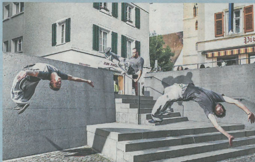
Free-Z aus Zofingen