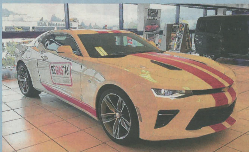
Diesen exklusiven Camaro gibt es bei der Tombola zu gewinnen (6 Monate kostenlos fahren)