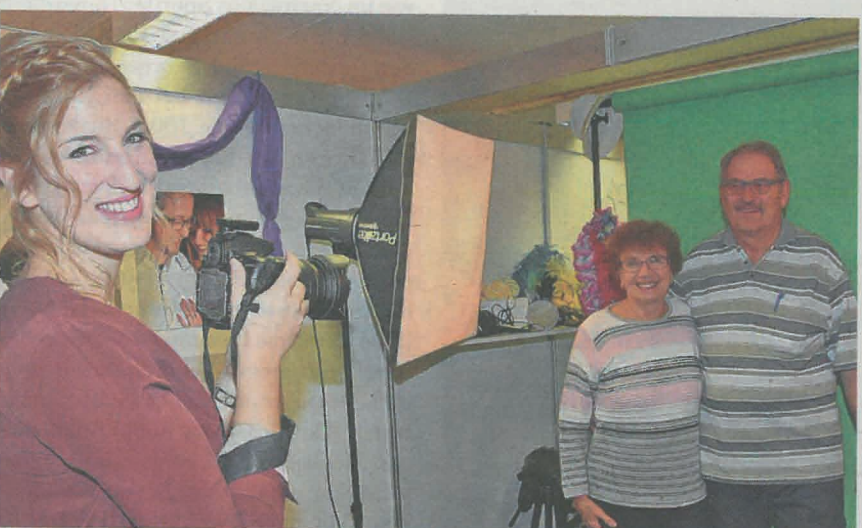
Tamara Fischer vom Fotostudio Fischer, Safenwil fotografierte die Gäste und verlieh ihnen mit Greenscreen einen originellen Hintergrund