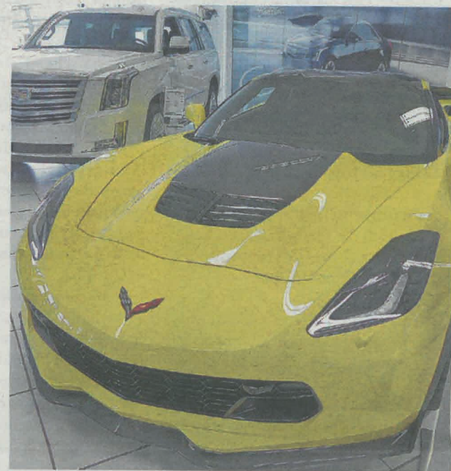
Zur REGAS gehören natürlich auch «rassige» Autos aus dem Hause Emil Frey