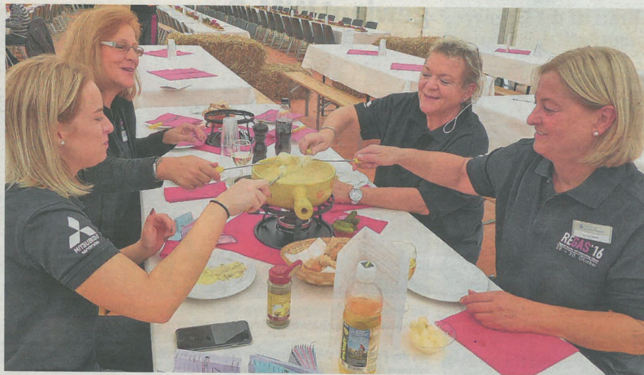
Auch die fleissigen Mitarbeiterinnen im Festzelt gönnten sich ein feines Fondue